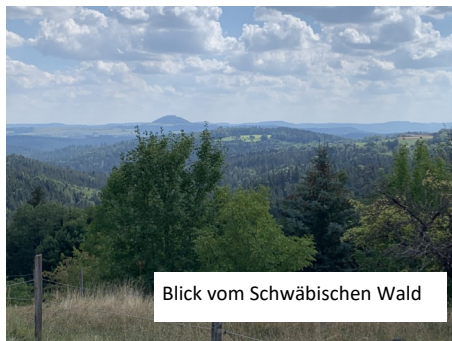
Blick vom Schwäbischen Wald